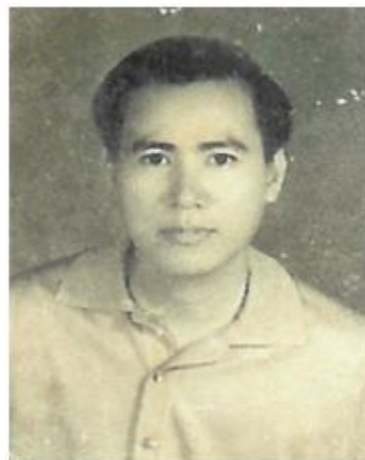
Trước khi ngồi tù