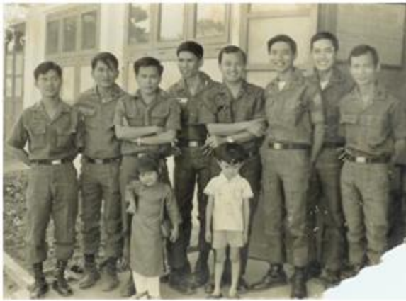
Quân Y Viện Trương Bá Hân Sóc trắng 1973