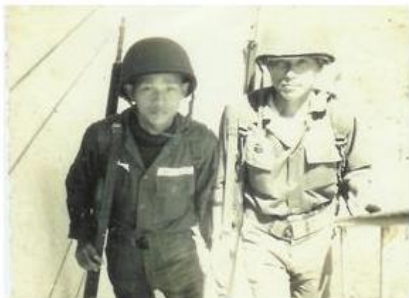
Hình ảnh ở Quân trường Đà Lạt 1968

Hổ buồn thăm thẳm mắt xanh xao Ngực còn hơi thở hời máu đào Bận lòng ngọn gió từ đâu lại Lộng bóng hồn ta nước xôn xa