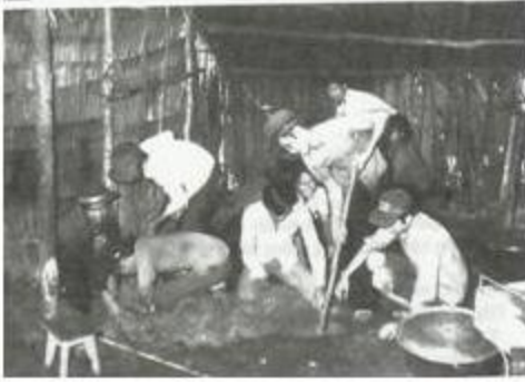
Hình ảnh xây dựng BV Huyện Mỹ Tú 1976