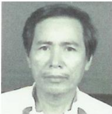
Sau khi ra khỏi tù