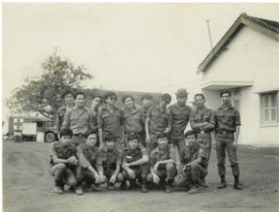
Trên Bệnh Viện tiểu khu Phước Long 1971.