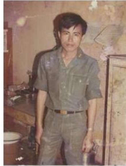
BV Tiểu khu Phước Long

Thu đến rồi cảnh tha ma Hồn thiên chan lệ ánh nắng tà Voi từng tiếng nát trong khóm lạnh Nên hỡi vì ta nở gấm hoa