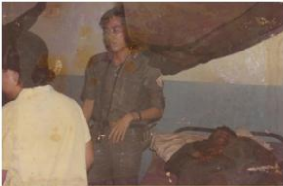
BV Quân Dân Y phối hợp ở Phước Long 1972