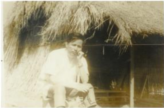
Hình ảnh ở Phước long