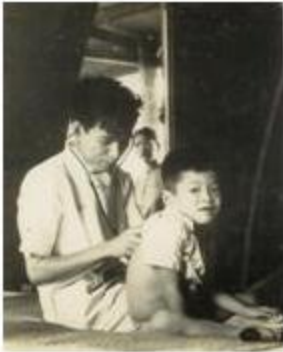
Hình ảnh khoa Nhi tỉnh Phước Long

Tập THƠ này viết trong Khám Lớn Sóc Trăng.