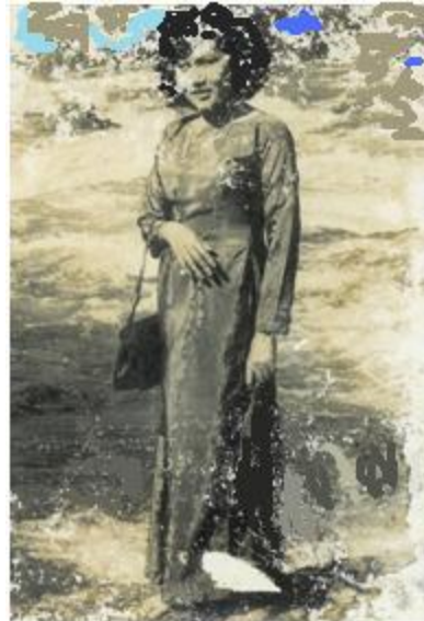
Em gái tôi, thay thế hình ảnh chị Hai tôi

Thăm con chốc lát rồi mẹ đi Âm dương hai cảnh đã biệt ly Mẹ ơi xin mẹ đừng lưu luyến Con nguyện lo thân chẳng lỗi nghi