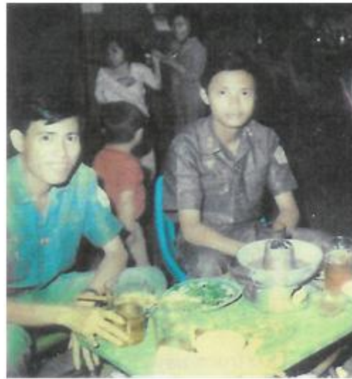
Phước Long 1972 (BS Đoàn)