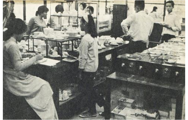
Saigon Departo là dãy nhà phía bên trái, góc ngã tư Tự Do - Thái Lập Thành - Ảnh: T.L Khu bán đồ gốm sứ, sơn mài và quạt điện - Ảnh: T.L

Trên báo xuân Chính Luận năm 1969, bài phóng sự của H.Thủy Ba bộ mặt của Tết Sài Gòn có nêu: “Đi đến đường Tự Do mà không ghé Saigon Departo thật là một thiếu sót. Trong dịp tết đến, Saigon Departo được huy động toàn lực để... vét túi khách hàng giàu sang”. Tác giả viết tiếp: “Dân nghèo mà vô đây thì đúng là cảnh chim chích lạc vào rừng. Các món nữ trang, mỹ phẩm đến các đồ tiểu thủ công nghệ chẳng hạn như đèn trang hoàng, giá cũng phải ba bốn chục ngàn một món. Dân nghèo sức mảy mà sờ vào đó... Ít người tay xách nách mang vì có xe hơi bên cạnh, mua gì là họ gọi tài xế tổng ngay lên đó chờ về nhà...”.