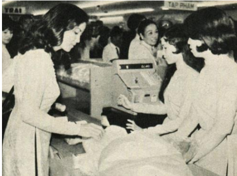
Diễn viên điện ảnh Kiều Chinh đến mua hàng tại siêu thị Nguyễn Du trước 1975

Siêu thị Nguyễn Du, khu siêu thị đầu tiên ở Sài Gòn và có thể nói là toàn cõi VN mở cửa năm 1967, mang đến cho nhiều gia đình công tư chức ở Sài Gòn những tiện lợi trong chuyện mua sắm mà trước đó không hề có.