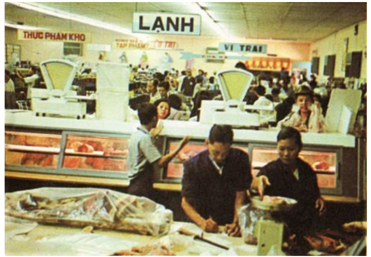
hình ảnh về siêu thị Nguyễn Du - siêu thị đầu tiên ở Việt Nam Trích từ Sài Gòn - Chuyện đời của phố