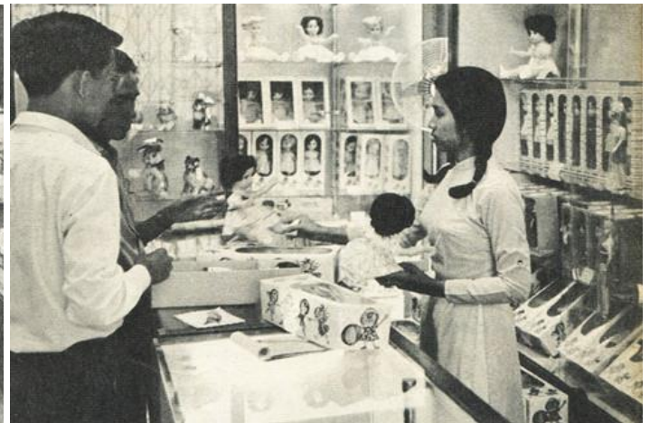
Khu bán đồ chơi và búp bê

Sự hiện diện của loại hình trung tâm bách hóa tổng hợp ở VN có bề dày không lâu và do người Pháp lập nên. Nổi tiếng nhất miền Bắc là Gô đa (tiếng Pháp là Godard) sang trọng bậc nhất thời Pháp thuộc, nay là Tràng Tiền Plaza. Còn ở miền Nam, đó là thương xá Tax. Tòa nhà bách hóa tổng hợp này có lịch sử lâu đời, được bắt đầu từ những năm 80 của thế kỷ 19, lúc đầu mang tên Les Grands Magazins Charner (GMC).