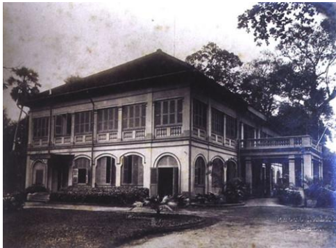
Tòa Bồ Gia Định xưa

Cô Tám nhắn tin trên Facebook hỏi tôi có biết cái hẻm nhà cô hồi đó gọi là hẻm “Ba cây Sao” không? Đó là cái hẻm trên đường Nguyễn Văn Học xưa.