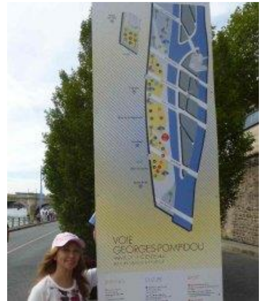
Bãi cát và lối đi bộ gần Pont Neuf - Cây dừa và sông Seine Pont Au Change