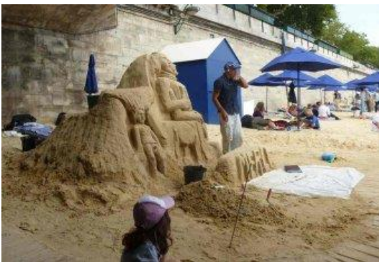
Mô hình trên cát