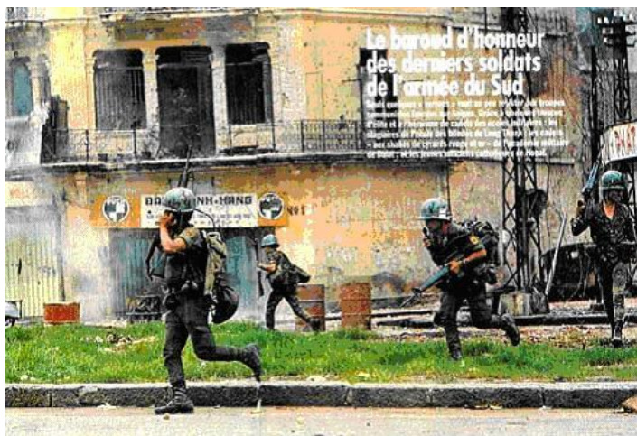
Những Thiên thần mũ nâu trong trận đánh cuối cùng ngày 3- 4- 1975 tại Phú Lâm dưới ống kính ký giả Pháp.