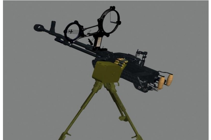
“Gà cồ” 12 ly 8, đại liên phòng không rất lợi hại trên chiến trường Việt Nam.

Súng tứ bề nổ rân, không còn phân biệt được của bạn hay thù. Địch bắt đầu pháo 82ly xuống khu đồi sau lưng. May, Đại đội đã rời khỏi. Thám Báo nhanh như sóc, vừa bắn túi bụi vừa chiếm từng mô đất để tránh 12ly8 trực xạ. Hạ sĩ Đợi ở Bộ Chỉ Huy kẹp hông cây đại liên khắc liên hồi xuống cái chốt trước mặt, nơi chòm đá, Trung đội 2 của Hôn không thể thấy. Các tràng M60 làm đám lính Biệt Động đang lo ngại dưới thung lũng lên tinh thần, vọt đứng dậy lao nhanh vào chân đồi, dù Cộng quân bắn ra xối xả.