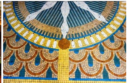
Thương xá Tax di tích trăm năm của TP Sài Gòn - Đúng 14 giờ ngày 25 tháng 9 2014 đóng cửa Thương xá Tax hàng chữ Goodbye như lời chào vĩnh biệt. --- Sàn lót gạch mosaic quý hiếm nên được bảo tồn