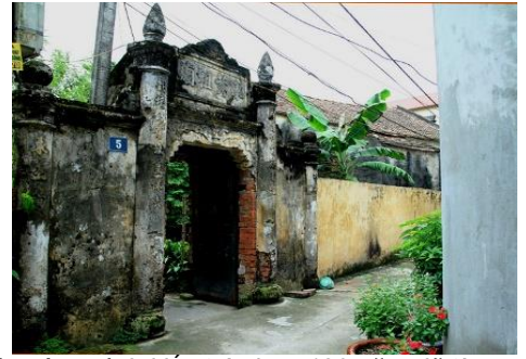
Có những ông già ngồi lặng nhìn TX Tax lần cuối --- Nhiều tiểu thương nán lại thần thờ nhìn công trình kiến trúc hơn 130 năm đã từng gắn bó cuộc đời mình. --- Chiếc cổng hình tháp bút trăm tuổi ở "Làng tiến sĩ" được nhiều du khách chiêm ngưỡng và ca ngợi.