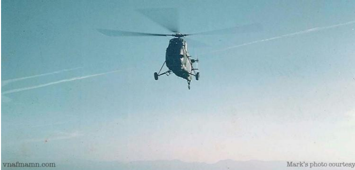
H-34 of VNAF Kingbee 219th squadron is about to land at a fire support base near Khe Sanh (Feb. 1968)