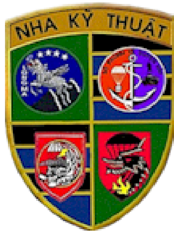
Những hình ảnh can trường.