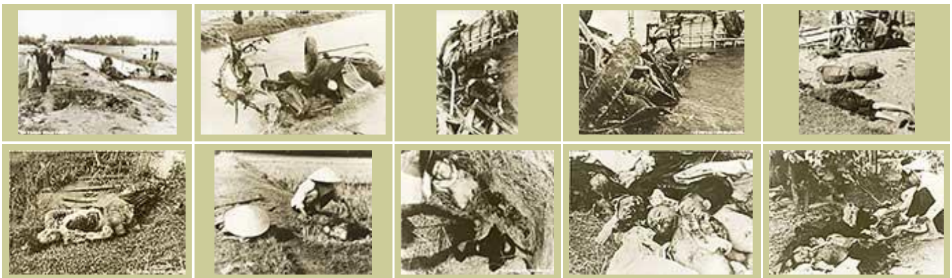
VIET CONG MINES IN PHU YEN PROVINCE

Sau năm 1975, bọn giặc đã làm phim “Biệt động Sài Gòn”, ca ngợi những “chú Tư Cầu” đi đặt bom giết người là “anh hùng”! Bọn chúng đã dựng lại vụ nhà hàng Mỹ Cảnh bị đặt hai quả bom. Sau khi quả bom đầu nổ, khoảng nửa tiếng đồng hồ sau, quả bom thứ hai dẫu trong chiếc xe đạp phát nổ, làm chết những toán cứu thương, lính cứu hỏa và cảnh sát! Đây chỉ là một trong hàng triệu tội ác của bọn giặc đã gây nên trong suốt 20 năm bọn chúng xâm lược miền Nam.