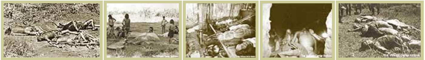
Tàn sát ở Dak Son