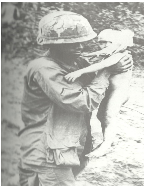
Một quân nhân thuộc Sư Đoàn I Không Kỳ Mỹ bồng một em bé thương trong vùng Bồng Sơn, lên trực thăng, 1968