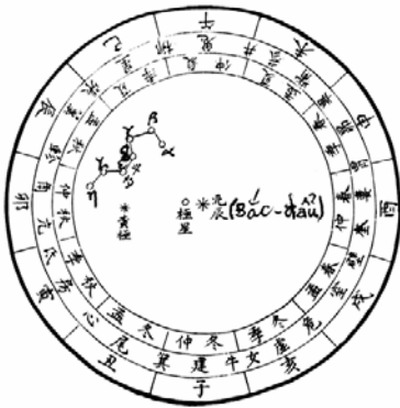
Hình 1 Đại-hùng-tinh (Ursa major)

tại hình chiếu Bắc-đầu, chỉ vào giữa cung tương-ứng (tý, sửu, dần) của thiên-bàn, với mặt trời xoay theo chiều kim đồng-hồ trên hoàng-đạo.