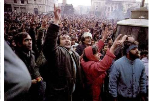
1989 Revolutions in the East