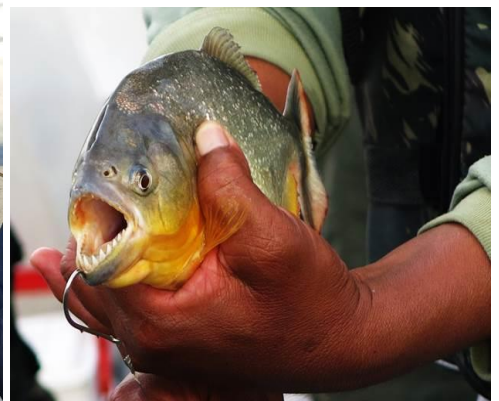
Răng của nó nhọn ghê chưa, hàm rất mạnh! Thử đưa ngón tay zô miệng nó đi, hihi... nó tấp cho 1 cái là biết ngay đó ạ, hihi...