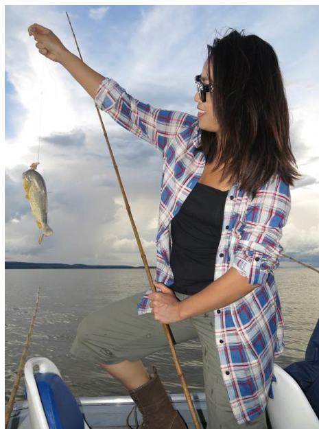
Con thứ nhì...