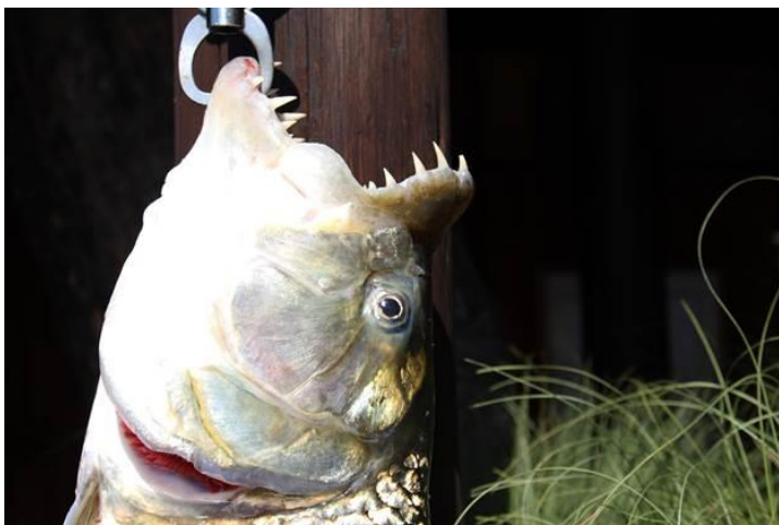
Răng của nó nhọn hoắc à