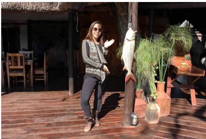
Tiger fish Phương An câu được