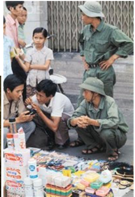
Cán Ngổ hống chuyện các anh bán chợ trời

Xe đạp thì Sài Gòn cũng không hiếm và chạy đầy đường, kiểu cách thì đa dạng không như xe Phượng Hoàng của Trung Quốc vốn lâu nay làm chúa đường phố Hà Nội.