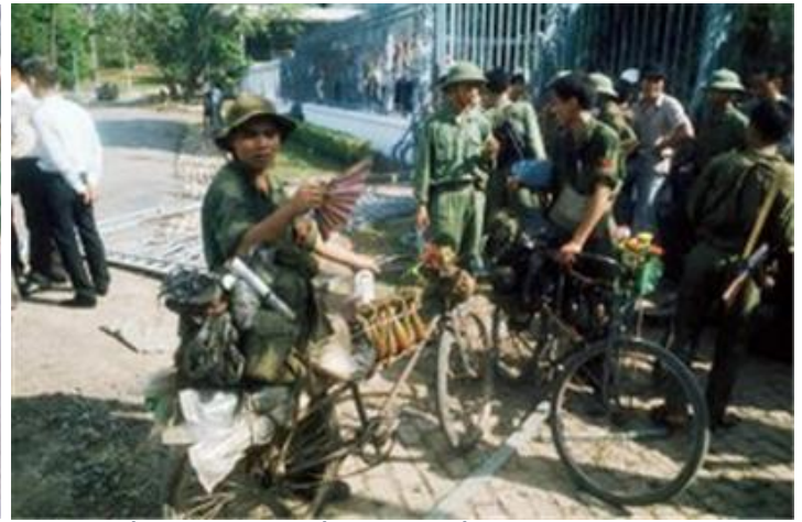
Cán ngõ bên những chiếc xe đạp thồ trước dinh Độc Lập

Bước vào khu vực chợ trời, bạn sẽ được chào đón bằng câu: ‘Có gì bán không anh?’. Nhiều người tỏ vẻ bất bình trước câu hỏi sỗ sàng đó, có người lại trả đũa một cách khó chịu: ‘Tôi bán tôi, anh có mua không?’. Sau này, không ngờ câu hỏi cay cú đó lại được sử dụng ở các chợ người, hay còn gọi là ‘chợ lao động’.