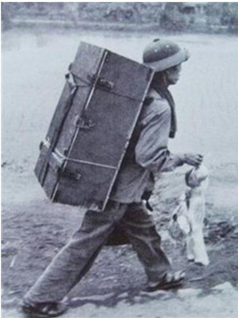
Quà từ Sài Gòn mới giải phóng

Radio thì ở miền Nam hầu như gia đình nào cũng có, nào là Sony, National, Zenith... có đủ cả AM lẫn FM. Tình thế đã thay đổi nên nhu cầu nghe radio không còn cần thiết, cách tốt nhất là đem ra chợ trời bán lấy tiền mua gạo.