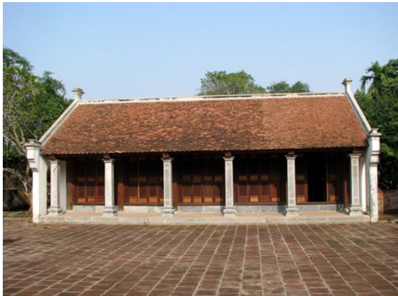
Du khách sẽ được chiêm ngưỡng những tác phẩm chạm khắc gỗ tinh xảo

Chùa Bà Đanh có tên chữ là Bảo Sơn tự, ngoài thờ Phật còn thờ Thái Thượng Lão Quân, Nam Tào, Bắc Đẩu và Tứ Pháp trong tín ngưỡng dân gian Việt Nam (bao gồm Pháp Vân - mẹ Mây, Pháp Vũ - mẹ mưa, Pháp Lôi - mẹ Sấm, Pháp Điện - mẹ Chớp). Lịch sử xây chùa Bà Đanh gắn liền với nhiều truyền thuyết lạ kỳ như tích về mẹ Phật Man Nương – được cho là nguồn gốc của Tứ Pháp – vốn lưu truyền rộng rãi ở các tỉnh đồng bằng Bắc Phần.