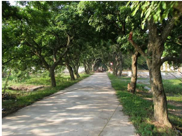
Con đường nhỏ dẫn vào chùa Bà Đanh rợp bóng nhãn, vải

Đi qua chiếc cầu treo Cẩm Sơn khá bề thế bắc qua sông Đáy, vòng lên một đoạn đường đê vắng vẻ, chúng tôi bắt gặp tấm biển bằng đá ghi “Di tích lịch sử văn hoá chùa Bà Đanh và núi Ngọc” . Chùa Bà Đanh thuộc địa phận thôn Đanh, xã Ngọc Sơn, huyện Kim Bảng, tỉnh Hà Nam, cách núi Ngọc khoảng 100m. Từ núi Ngọc và từ chân đê, đi qua những đoạn đường nhỏ vắng lặng rợp bóng vải thiều, nhãn..., du khách sẽ thấy tam quan chùa Bà Đanh hướng về phía con sông Đáy thơ mộng. Khoảng sân rộng được lát đá trồng nhiều loại cây như đa, hoàng lan, sứ... Những cây bưởi trĩu quả vỏ vàng tươi tắn, những cây táo ta sai quả gợi nên hình ảnh một cuộc sống thanh đạm mà trù phú. Đặc biệt, ngôi chùa trồng một cây đào tiên tán thấp có quả to, tròn và dẹt dẹt như bưởi nhưng vỏ nhẵn thín màu xanh bóng, chi chít đầy cành.