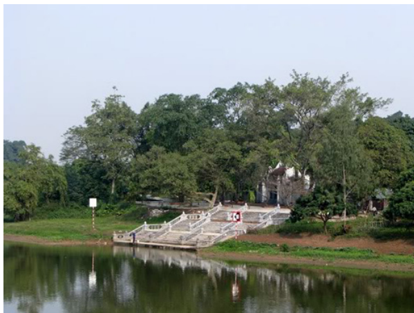
Chùa Bà Đanh hiện ra thấp thoáng sau những bóng cây.

Từ thành phố Phủ Lý rẽ vào quốc lộ 21, đi cầu Quế khoảng hơn 1km, chúng tôi thấy chùa Bà Đanh thấp thoáng hiện ra sau những bóng cây. Ngôi chùa u tịch nhìn ra con sông Đáy trôi chảy hiền hòa. Bền nước của chùa Bà Đanh nằm thoải thoải bên bờ sông, các bậc đá màu xám ngà ngà nổi bật giữa màu xanh của cây cỏ và dòng nước phẳng lặng như gương.