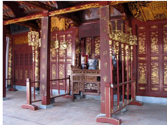
Một toà nhà trong tổng thể kiến trúc chùa Bà Đanh