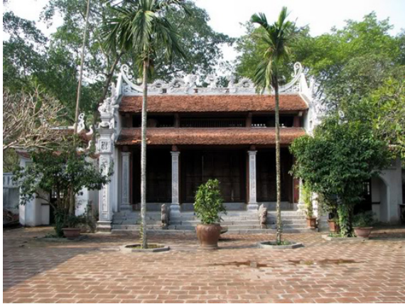
Một góc sân chùa u tịch

Ngay gần đó là một bến nước lớn uy nghiêm nhưng vắng vẻ, trên các bậc lên xuống của bến nước, lá đa rụng đầy gợi không khí u tịch. Đứng trên bến nước, ngắm nhìn khung cảnh sơn thủy hữu tình, cái lặng yên nhắc cho trái tim mẫn cảm nhớ đến câu thơ của Trần Đăng Khoa: “ Ngoài thềm rơi chiếc lá đa/Tiếng rơi rất mỏng như là rơi nghiêng ”.