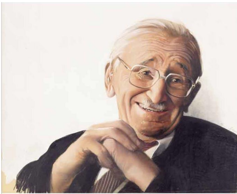
F.A. Hayek (1889-1992) Nobel laureate, Cato Institute Honorary Distinguished Senior Fellow

Phong trào đấu tranh cho chủ nghĩa tự do đã xuất hiện tại Trung Quốc trước khi Mao Trạch Đông cướp chính quyền năm 1949, nhưng không thành công vì đã phạm lỗi lầm mà giờ đây cần xét lại. Thời bấy giờ, “chủ nghĩa Tự Do Cổ Điển” (Classical Liberalism) chưa phải là thứ mà các nhà tranh đấu dân chủ Trung Hoa áp dụng. Họ mới chỉ biết tới thuyết Tự Do mang tính xã hội của John Dewey và Harold Lasky. Vì chạy theo thuyết này nên họ đã không quan tâm đến kinh tế thị trường, quyền tư hữu và tự do kinh doanh là những mục tiêu cốt yếu cần ưu tiên thực hiện. Thay vì trông gương Cách Mạng Hoa Kỳ năm 1786 họ đã chịu ảnh hưởng của cuộc Cách mạng Pháp năm 1789.