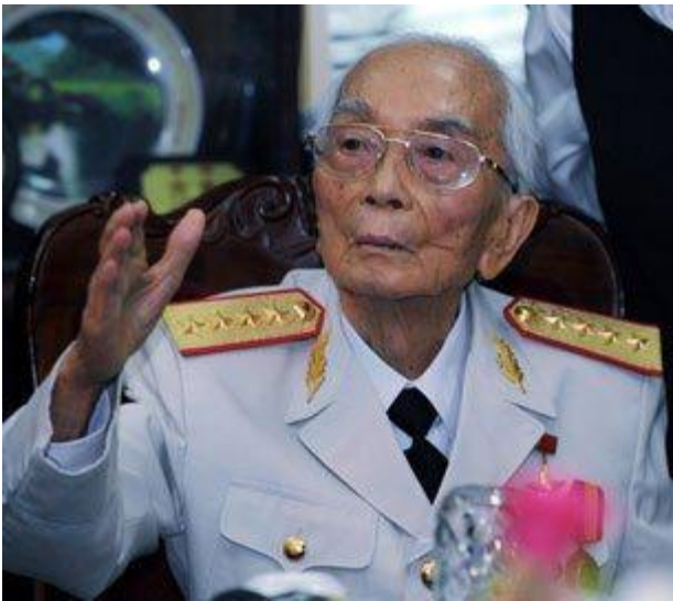
Tướng việt cộng Võ Nguyên Giáp

Đùng một cái Võ Nguyễn Giáp theo Sắc Lệnh số 110/SL ngày 28/5/1948, được Hồ Chí Minh đưa lên làm “Đại Tướng” , đùng một cái mất hết! Cho thấy thực ra Giáp cũng chẳng có tài cán và thế lực gì đặc biệt. Phần lớn thành tích đều là tuyên truyền và chiến công đều bằng sự hy sinh xương máu của hàng trăm ngàn bộ đội và dân chúng.