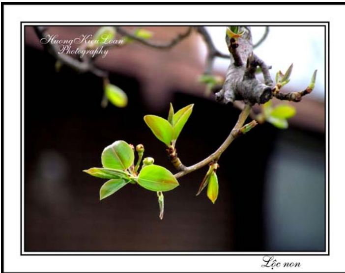
(Một cành lê sau vườn)