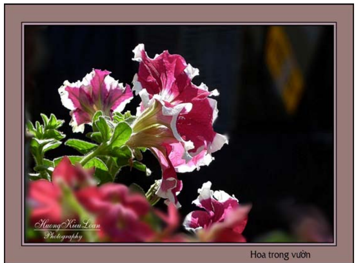
Hoa trong vườn

Vườn hoa của thành phố rất gần nhà, lái xe chừng 10 phút là đến, tôi mua thẻ hội viên, có thể đến bất cứ ngày nào, nhưng tôi vẫn muốn trồng nhiều hoa ở vườn nhà, không gì thích thú khi xem hoa nở mỗi ngày, giờ giấc khác nhau, nên vẻ đẹp cũng khác, sắc màu cũng khác, và tôi có thể thu chúng vào ống kính bất cứ lúc nào, theo ý thích, chỉ cần năm, mười phút là tôi có một số ảnh ưng ý.