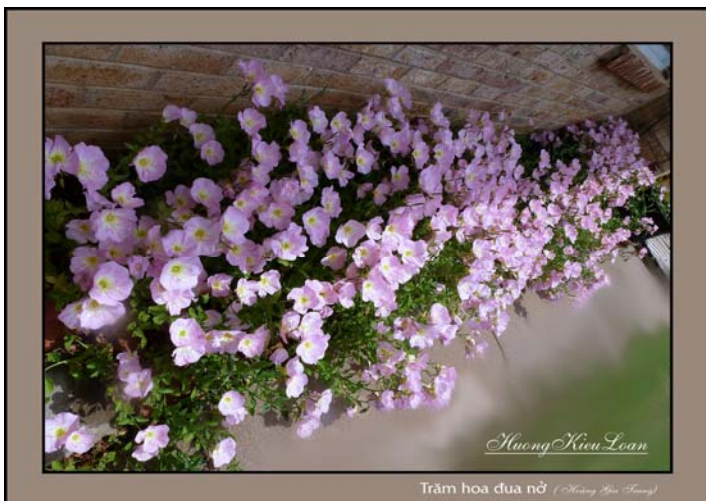
Trâm hoa đua nở (Hương Kiều Loan)

Có người bạn chụp được một cánh đồng đầy hoa cánh bướm. Tôi vốn thích loại hoa này nên một người bạn đã cho tôi mấy gốc, và tôi thật thích thú khi có chúng, vì chúng không cần nhiều chăm sóc. Chúng tự sống còn, sinh sôi nảy nở, để năm sau không còn cọng cỏ dại nào dành đất với chúng được. Mấy năm trước tôi đã khốn khổ vì lũ cỏ dại, cỏ chen lấn vào những khu vực tôi trồng hoa, và lì lợm chôn chân ở đó, dù nhiều lần đã bứng tận gốc.