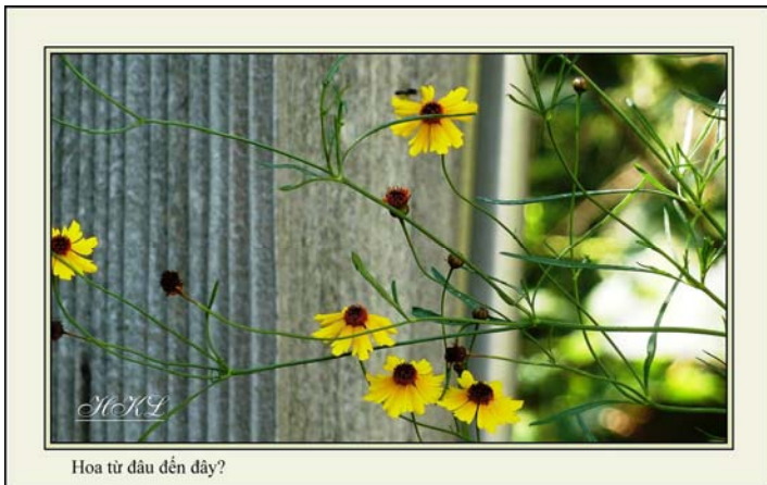
Hoa từ đâu đến đây?

Chỉ một giây thôi, khi ánh nắng chiếu đi chỗ khác, nó không có gì đẹp nữa, mà cần cắt bỏ vì vướng tầm nhìn. Tội nghiệp thay!