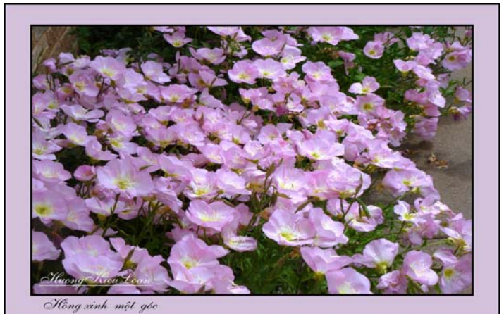
Hồng sinh một góc

Những bông hoa vàng dại này, hột đã từ đâu bay lại, để tranh đấu giành sống trên một lẵng hoa treo, tôi không nở loại trừ. Tôi đã nhìn thấy chúng ở ven sông một năm nào, rồi chúng biến mất. Tuy là hoa dại, nhưng không phải năm nào cũng được trở lại kiếp sống, có thể nhân viên của thành phố đã rải thuốc trừ khử chúng. Năm nay tôi cũng đi bộ ven sông, nhưng không nhìn thấy loại hoa này nữa.