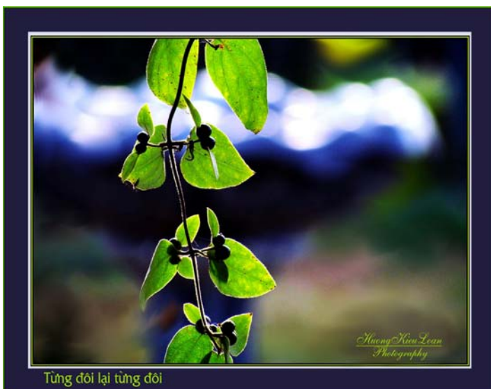
Tùng đôi lại tùng đôi

Vườn hoa của thành phố rất gần nhà, lái xe chừng 10 phút là đến, tôi mua thẻ hội viên, có thể đến bất cứ ngày nào, nhưng tôi vẫn muốn trồng nhiều hoa ở vườn nhà, không gì thích thú khi xem hoa nở mỗi ngày, giờ giấc khác nhau, nên vẻ đẹp cũng khác, sắc màu cũng khác, và tôi có thể thu chúng vào ống kính bất cứ lúc nào, theo ý thích, chỉ cần năm, mười phút là tôi có một số ảnh ưng ý.