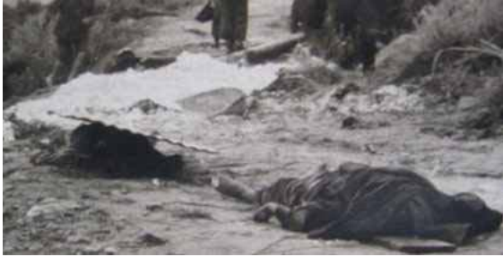
Thị xã Hà Giang, Quân đội nhân dân Trung Quốc hãm hiếp phụ nữ từ già đến trẻ không tha thứ một ai; Nguồn Ảnh: Hoa Chí Cường.

chế một quân đoàn 50.000 quân, một sư đoàn 12.900 quân, tổng số quân Trung Quốc tham chiến phản công tự vệ trên chiến trường biên giới Việt Nam từ 450.000 đến 500.000. Chưa tính (XXXXX Tập đoàn biệt lập) đặt bản doanh Bộ tư lệnh tại thị trấn Tĩnh Tây, chờ ứng chiến.