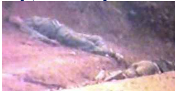
Quân đội nhân dân Trung Quốc tử vong tại đầu nguồn sông Lô lãnh thổ Việt Nam.