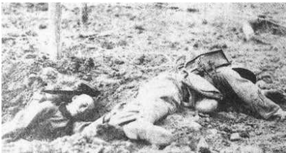
Quân đội nhân dân Trung Quốc tử vong trên đường 22 Hà Giang Việt Nam.

— Thưa, anh Cường thế thì Sư đoàn 40 của anh có tham gia vào những sự việc mà anh vừa trình bày không?