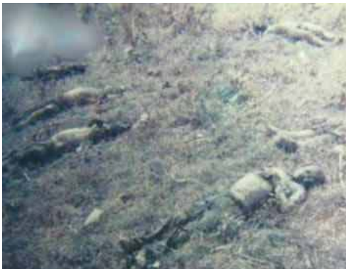
Quân đội nhân dân Trung Quốc tử vong trên đường 22 trong lãnh thổ Việt Nam.

Cả hai đảng CS Việt Nam và Trung Quốc xem cuộc chiến tranh này không khác nào một trò chơi giải trí, chúng nó khai thác tâm lý bảo vệ xóm làng, đẩy thường dân làm là chắn biển người, còn dân quân làm thân bia đỡ đạn, cảnh chiến tranh đem đến cho nhân dân Việt Nam tại biên giới nhiều tổn thất nhất, rồi mới đến thường dân thị xã Hà Giang, người người làm than khắp nẻo đường, tài sản bỗng chốc hóa trắng tay, chỉ vì bốn chữ "phản công tự vệ" của Đặng Tiểu Bình. Mấy ngày đầu, quân chủ lực của đảng CSVN chưa thấy tên nào xuất hiện, hoàn toàn mở cửa 6 tỉnh, thị xã Lai Châu, Lào Cai, Hà Giang, Cao Bằng, Lạng Sơn, Quảng Ninh. Quân đội Trung Quốc tung hoành theo ý đồ của Đặng Tiểu Bình "dạy cho Việt Nam một bài học" quân đội Trung Quốc như kẻ nằm mơ trong chiến thắng cứ thể tha hồ làm mưa làm gió, hãm hiếp phụ nữ từ già đến trẻ không tha thứ một ai! Nam giới thương vong la liệt từ biên giới đến thị xã, có nhiều thường dân bị thương chờ ngày chết, tàn nhẫn nhất là những bé gái và trai từ sơ sinh cho đến 15 tuổi v.v... đem ra làm tấm bia thi nhau bắn, trúng được thưởng một liều thuốc lá Chungghwa. Sau đó, vài ngày chúng tôi không còn thấy người Việt nơi chúng tôi đóng quân, làm tôi rất phân vân, không biết họ sống chết thế nào ?