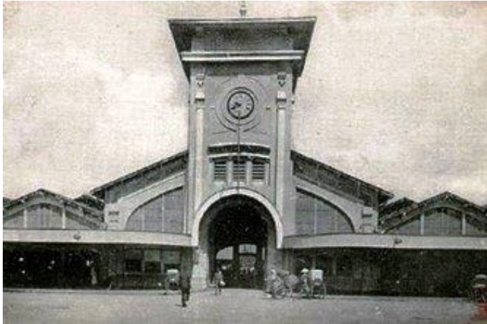
Chợ Bến Thành năm 1914

Hàng ngàn bà con Sài Gòn lẫn dân Nam kỳ lục tỉnh đã tận mắt coi trận đấu có lẽ chưa từng có trên thế giới ngay lễ khai trương chợ Bến Thành tháng 3-1914: một cô gái giỏi võ Việt vờn nhau với một con cọp đang gầm rú liên hồi.