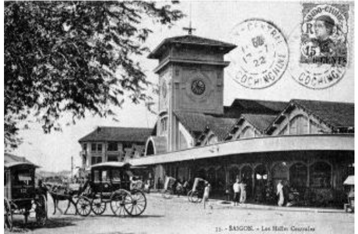
Chợ Bến Thành năm 1921, bảy năm sau ngày khai trương

Chợ Bến Thành là ngôi chợ lớn giữa Sài Gòn. Ngôi chợ này do một hãng thầu của Pháp mang tên Brossard et Maupin xây dựng, khánh thành vào tháng 3-1914. Chính quyền đương thời đã tổ chức lễ khánh thành chợ gọi là lễ khai trương chợ Bến Thành mới, mà báo chí thời đó gọi là “Tân Vương Hội”, gồm các hoạt động vui chơi kéo dài ba ngày đêm 28, 29 và 30-3-1914 với hơn 100.000 người ở Sài Gòn và các tỉnh đổ về.