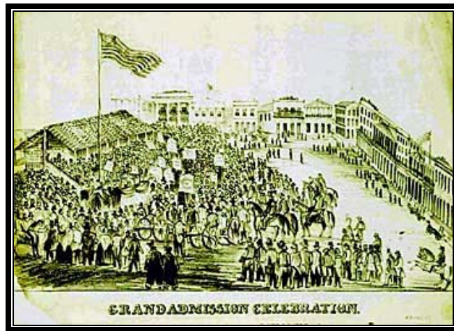
09-09-1850 San Francisco chào mừng CA 31st US State