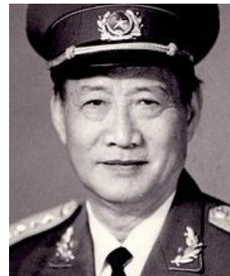
Hoàng Văn Thái