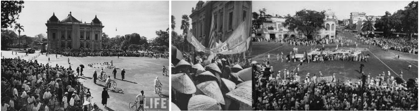
Buổi Mít-tinh của Tổng Đoàn Công Chức chào mừng chính phủ Trần Trọng Kim ngày 17 tháng 8, 1945. Cờ Vàng của tổ quốc đã từng treo rũ trước nhà hát lớn tại thành phố Hà nội 1945:

Sách vở cộng sản ồn ào đề cao ngày 19-8 và 2-9 như một kỳ công của họ vì cướp được chánh quyền về tay nhen dân. Họ dấu sự thật là hôm 17-8, công chức tổ chức biểu tình ủng hộ Chánh phủ Trần Trọng Kim và cộng sản chỉ có năm ba ngoe chen vào, giương cờ đỏ sao vàng lên, hô khẩu hiệu để biến cuộc biểu tình đó như của họ tổ chức để cướp chánh quyền. Buổi Mít-tinh của Tổng Đoàn Công Chức để chào mừng chính phủ Trần Trọng Kim bỗng chốc trở thành biểu tình của Mặt Trận Việt Minh. Về phía Chánh phủ Trần Trọng Kim lại không có Quân đội, không có cả một lực lượng võ trang dân sự, nên chánh quyền không được bảo vệ. Nhựt đã đầu hàng, Đồng Minh chưa tới. Việt nam vào lúc đó như một cái nhà bỏ ngõ, ai cũng có thể tới ở, không cần phải cướp.