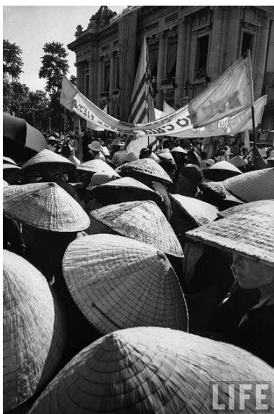
Đồng bào miền Bắc mít tinh với Cờ Vàng tổ quốc trước nhà hát thành phố Hà nội 1945

Nhưng cướp chánh quyền cho ai và dùng chánh quyền để làm gì? Điều ai cũng thấy rõ, Hồ Chí Minh cướp chánh quyền không phải cho nhen dân Việt nam mà "cho Liên-xô và Trung quốc" (Lê Duẩn). Và khi nắm được chánh quyền, Hồ Chí Minh dốc hết tâm huyết biến đất nước Việt nam trở thành cộng sản bằng cách thanh toán sạch tất cả những cái gì đang có, đào tạo con người Việt nam trở thành con người xã hội chủ nghĩa (trồng người).