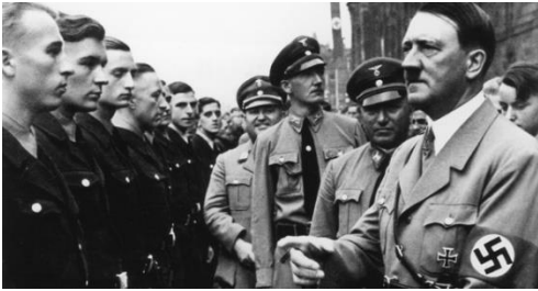
Hitler và Chính quyền III Reich

sưu tập gồm những bộ não của những nạn nhân trong chiến dịch "chết danh dự" T4 lúc đó nhằm triệt để loại bỏ những phần tử bất hảo của dân tộc Đức. Trong số này, nhiều trẻ con bị giết bởi vì chúng đem lại ích lợi lớn cho khoa học. Và hơn nữa, chính quyền III Reich cho rằng chúng tuy là dân Đức nhưng không xứng đáng được sống chung với những người khác.