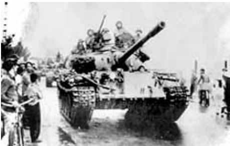
Xe tăng cộng sản vào Đà Nẵng đầy tình "chiến hữu",