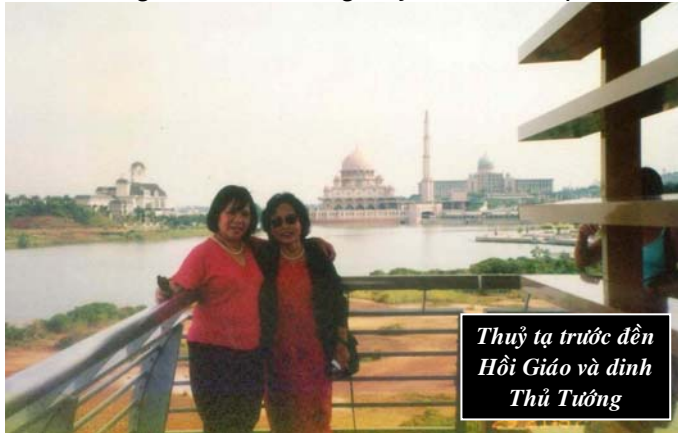
Thủy tạ trước đền Hội Giáo và dinh Thủ Tướng

ĂN TRƯA: Chúng tôi ăn trưa ở nhà hàng Rainbow Restaurant trong khu phố sạch sẽ có nhiều tiệm buôn quần áo tơ lụa, giày, ví.... Nhà hàng lớn, trang hoàng đẹp mắt nhưng món ăn không hợp khẩu vị của riêng tôi. Hầu như món nào cũng cay cay và có nước dứa. Cá chiên to trông ngon lành hấp dẫn nhưng nước sốt cũng cay. Rau xào quá nhiều tỏi. Tuy thế nước dứa, nước xoài rất ngon, nhất là