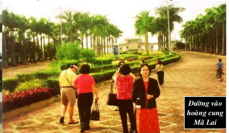
Đường vào hoàng cung Mã Lai

sau khi bị ăn cay, có ly nước trái cây mát lạnh, ngon không thể tả..