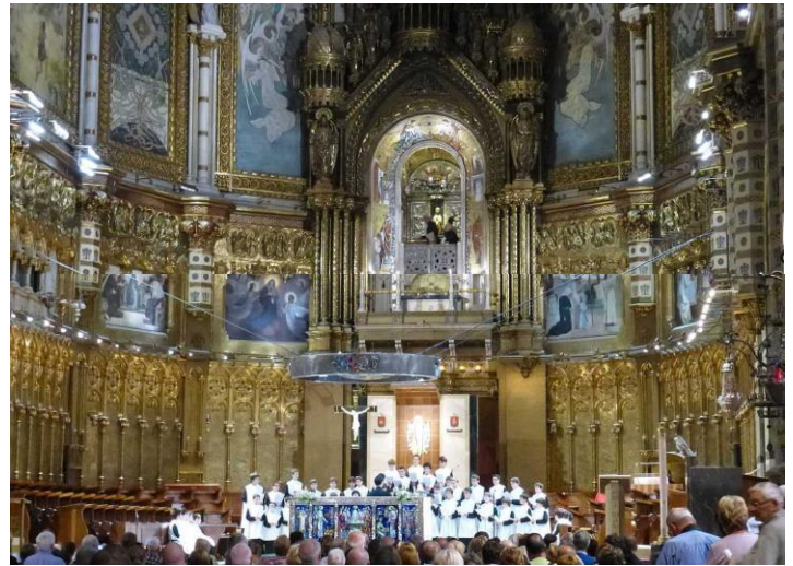
Hình bên trái: sàn gạch đá đen trắng của sân trước nhà thờ được kiến trúc dựa theo kiến trúc của Michelangelo ở Rome. Ở giữa sàn có ghi chữ Latin nói về lễ rửa tội. Hình bên phải: trong nhà thờ với đoàn thánh ca Escolia đang trình diễn; chính giữa và trên cao là tượng Đức Mẹ Đen.

Hàng ngày vào lúc 13:00, nhà thờ có đoàn thánh ca Escolania de Montserrat trình diễn trong chính điện. Bài thánh ca về Đức Mẹ của Montserrat gọi là Vilorai, bắt đầu bằng những chữ : “Rosa d’abril, Morena de la serra...” (April rose, dusky lady of the mountain chain...) vì thế mà tượng Đức mẹ này đôi khi còn được gọi là Rosa d’abril.