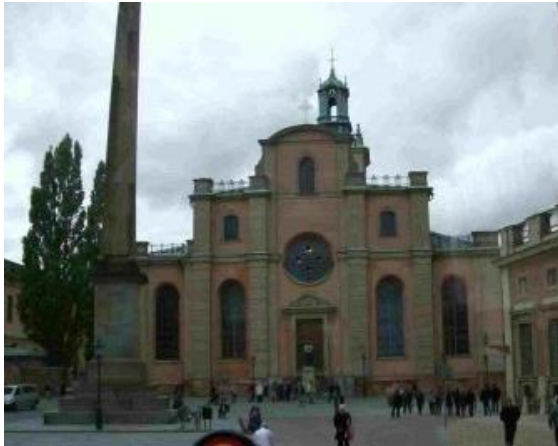
Nhà thờ, Hoàng Cung Quốc Gia

Cạnh cung điện Hoàng Gia là Nhà thờ thánh Nicholas, thường được biết như Storkyrkan (Nhà thờ Lớn) hay nhà thờ Stockholm, đây là ngôi nhà thờ bằng gạch cổ giản dị trong Gamla Stan được xây dựng từ năm 1306 - nay trở thành thánh đường của Stockholm. Từ bao đời qua, nhà thờ Stockholm là nơi diễn ra các lễ đăng quang, các hôn lễ và các nghi lễ tôn giáo của hoàng tộc. Bên trong thánh đường được thiết kế theo phong cách Baroque với nhiều tác phẩm điêu khắc từ thế kỷ XV, có tượng gỗ khắc thánh George và rồng, có những dãy ghế dành cho hoàng gia, có cả chiếc ngai vàng khổng lồ. Phía nam của nhà thờ là khu Stortorget, có giếng nước cổ của đô thành, với tòa nhà Stockholm Stock Exchange, chứa Thư viện Nobel, Bảo tàng Nobel và Swedish Academy (nơi mà những giải thưởng Nobel hàng năm được tuyên bố).