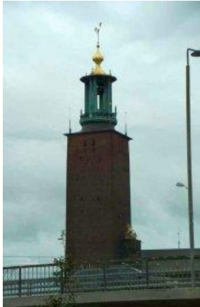
Tháp Tòa thị sảnh

Tòa thị chính thành phố Stadhuset - xây dựng từ 1911 đến năm 1923 mới hoàn tất, với tường gạch màu đỏ nhìn xuống hồ Malaren được xem là công trình đẹp nhất Thụy Điển. Tòa tháp Ba Vương miện của tòa thị chính được xem như là địa điểm lý tưởng để ngắm toàn cảnh Stockholm. Tại đây có hai đại sảnh được biết đến nhiều nhất: Đại Sảnh Vàng - nơi trưng bày nhiều hiện vật được chạm trổ hoặc khảm bằng vàng và pha lê, và Đại Sảnh Xanh. Kiến trúc sư Ragnar Östberg (1866-1945) là người vẽ kiểu Tòa nhà thị chính. Xây cất tòa nhà này mất 12 năm mới hoàn tất. Được biết là họ đã dùng gần tám triệu viên gạch đỏ, loại gạch gọi là gạch xây nhà thờ vì thường được dùng để xây thánh đường và tu viện. Tòa nhà được khánh thành vào ngày 23 June 1923.