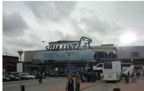
Khu chợ trời Kauppatori. Tượng Havis Amanda -- Silja Line

Buổi chiều thì chúng tôi đi ra bến tàu; rời Helsinki bằng tàu Silja Line để đi Stockholm, thủ đô của Vương Quốc Thụy Điển. Tàu Silja tuy không lớn như những hãng tàu du lịch đường biển nhưng cũng khá tốt và trên tàu cũng có những màn trình diễn vui mắt và cả hợp tấu nhạc cổ điển.