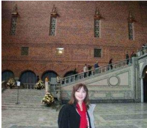
Đại sảnh Xanh