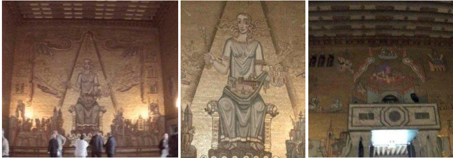
Đại sảnh Vàng

mở rộng để bà có thể nhìn khắp thành phố, đôi chân lớn để bà có thể đứng vững mạnh, và tóc bà tượng trưng cho Mặt trời chứ không phải là tóc rắn của Medusa. Một điểm khác cũng đáng để ý nếu chúng ta ngược mắt nhìn lên cao nơi tiếp giáp tường với trần nhà thì thấy bức tranh mosaics lớn này dường như hơi ngắn ở phía trên trần, phần mosaic phía đáy được nâng hơi cao cùng phần trên chỉ cách trần nhà có một chút. Lý do người làm mosaic đã quên ước lượng dải padding ở chân tường, và vì thế bức mosaic đã phải thực hiện cao lên trên 30 cm. Vì công trình thực hiện kéo dài hơn hai năm, nên đến gần phức chót thì thợ làm việc mới nhận thức được lỗi làm lớn này nhưng đã quá trễ để thay đổi hay sửa lại. Kết quả tấm mosaic lớn này có một chút mất quân bình nhưng trông vẫn bình thường. Tuy nhiên nếu chúng ta sau khi bước vào Đại sảnh Vàng, quay lại nhìn lên trần phía trên cánh cửa thì sẽ thấy bức hình của thánh hộ trì Stockholm, St Erik, đã không có đầu vì bị cắt ngang bởi trần nhà.