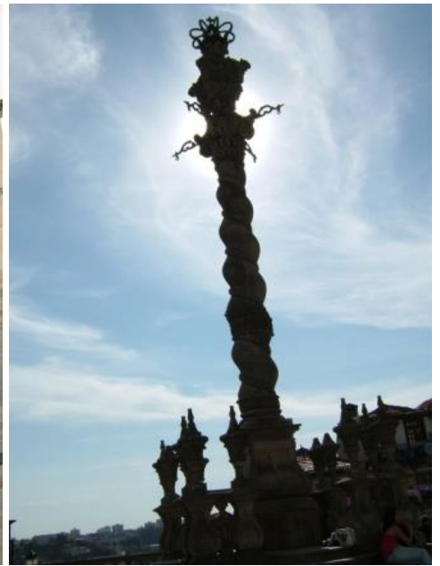
Nhà thờ Thánh đường - Sé

Phái đoàn của Sao Khuê đến Porto vào chiều thứ bảy. Khách sạn nằm ngay trung tâm thành phố. 'Check in' xong là kéo nhau đi phố. Xế ngay trước hotel là một nhà thờ của thành phố. Mặt ngoài nhà thờ đập vào mắt là những trang trí bằng cẩm thạch màu xanh dương, màu xanh rất đặc biệt Portugais. Đường phố dĩ nhiên rất nhỏ hẹp mà nhằm chiều cuối tuần nên nhiều cửa tiệm đã đóng cửa. Ghé vào mua ít cam, trái cây là món không thể thiếu trong thực đơn hàng ngày. Đi bộ chút xíu thì đến cathédrale mà dân Portugais gọi là Sé. Nhà thờ này rất lớn nằm trên ngọn đồi Penaventosa được coi là biểu tượng của Porto. Một cái sân rất rộng gọi là Terreiro da Sé ở giữa có xây cây cột theo hình tròn ốc thật lạ mắt. Sé được xây từ thế kỷ XII và XIII mặt ngoài có cẩm thạch màu xanh dương đặc biệt của Portugal. Từ đây mà nhìn xuống thấy thành phố thật đẹp. Đã quá 6 giờ chiều, Thánh đường đã đóng cửa, không ai tha thiết vào thăm nhà thờ vì đã thăm quá nhiều nhà thờ nổi tiếng hồi đi Đông Âu năm ngoái 2007.