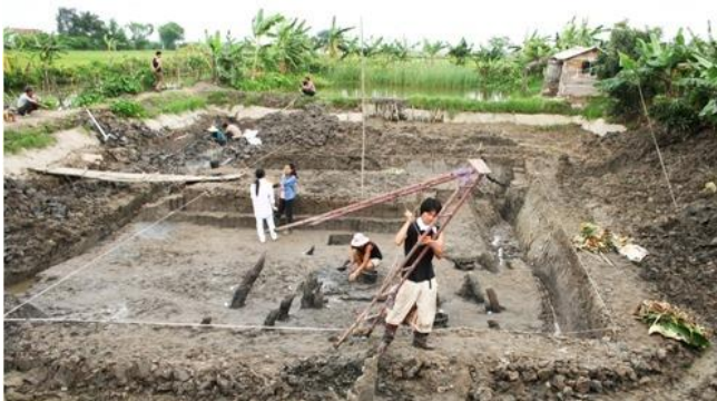
Khai quật bãi cọc đồng Má Ngựa năm 2010

Theo các nhà nghiên cứu, đây là nửa phía Nam của trận địa cọc Bạch Đằng, còn nửa phía Bắc là bãi cọc Yên Giang. Do giữa hai bãi cọc có một dải cồn đá cao, khi nước triều xuống thuyền không qua được buộc phải đi vào sát bờ. Vì vậy, Trần Hưng Đạo đã chọn vị trí cắm cọc ở hai bên cồn đá tạo thành một phòng tuyến hình chữ V bịt chặt lấy họng sông Bạch Đằng để chặn đường rút lui của quân địch tạo nên chiến thắng vẻ vang của trận chiến trên sông Bạch Đằng năm 1288.