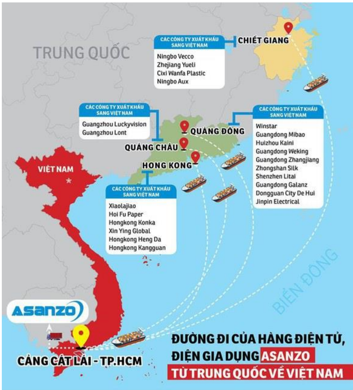
Asanzo lừa đảo.