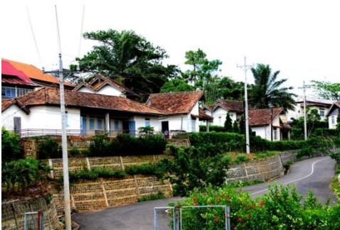
Làng cù Di Linh