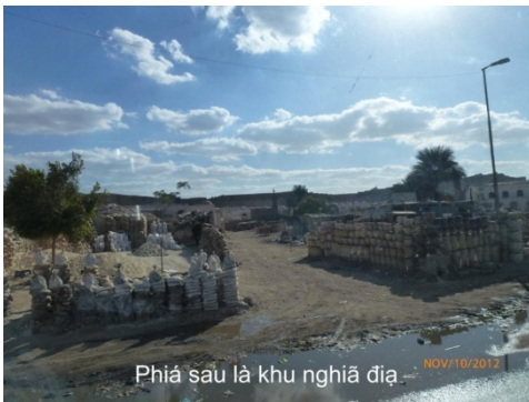
Phía sau là khu nghĩa địa... NOV/10/2012

Trong chợ là những gian hàng chật hẹp, mùi hôi của thuốc lá làm cho mình cảm thấy ngột thở. Có nhiều hàng nước giải khát, cafe nhưng tuyệt đối không có bán rượu bia, dọc theo đường trên chiếc xe kéo cũ thô sơ bán bắp, khoai lang nướng giống ở Việt Nam, nơi này du khách luôn bị quấy rầy bởi những người bán hàng rong, người xin đổi tiền, ăn xin... Cairo có 5 đại học lớn, đại học Al- Azhar của Hồi giáo có từ năm 983 sau CN, đường phố đông người các loại xe taxi chạy bằng gas, thường kẹt xe trong những giờ cao điểm, theo thống kê mà hướng dẫn viên du lịch cho biết sở dĩ Cairo còn nhiều nhà xây bỏ trống không xong, vì ngành địa ốc gặp khó khăn, họ đi vay tiền đầu tư tốn kém, xây nhà không cho thuê được thì lỗ vốn. Trong khi hơn 300 ngàn người nghèo, không nhà phải sống chen chúc trong nghĩa địa, dưới chân tường... Bởi vậy đời sống ở Cairo phức tạp chia làm hai khu giàu nghèo rất rõ rệt, hơn 20% người nghèo sống dưới 2.USD một ngày, dân nghèo không có bảo hiểm sức khỏe. Công chức và quân đội được hưởng bảo hiểm của chính phủ, nhưng lương thấp, bởi vậy họ phải làm thêm nghề khác để mưu sinh. Sau cuộc cách mạng Mùa Xuân năm 2011 đời sống người dân vẫn không thay đổi, chính phủ không thể kiểm soát bọn gian thương lợi dụng buổi giao thời bán xăng dầu qua Palestine để trục lợi... Tòa Đại sứ các quốc gia Tây phương và Hoa Kỳ được quân đội canh gác cẩn thận, tránh trường hợp những người cuồng tín gây bạo loạn giết người.