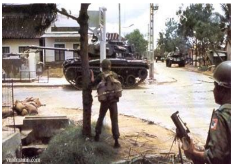
Mậu Thân, chiến đấu chiếm lại từng góc phố

người đối với con người: của các bà mẹ, của các em gái đón những đứa con yêu, những người anh can trường mang thân mình để bảo vệ đồng bào, quê hương đọa đầy. Ôi những em bé Huế dưới làn mưa đạn của quân thù đã đem đến cho chúng tôi những nắm cơm sấy trong biển cố Mậu Thân. Những vòng hoa chiến thắng của nữ sinh Quảng Ngãi đã choàng cho chúng tôi trong dịp Xuân 1966 sau Liên Kết 81, miền Trung đậm đà, miền Nam thương yêu, ở bất cứ chiến trường nào chúng tôi cũng tôn trọng kỷ luật của Quân đội và kỷ luật sắt thép của binh chủng là phải tôn trọng dân được dân mến, dân thương thì chiến thắng quân thù chỉ còn là bước chân nhẹ nhàng để đón nhận vinh quang. Tại những vùng tiền tuyến, đi đâu dân cũng mến, dân cũng thương đoàn quân Mũ Đỏ.