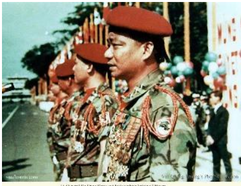
Chiến binh Nhảy dù Dục Quốc Đống, tư lệnh Binh chủng Nhảy Dù

Từ ngã 3 Bà Quẹo dân chúng còn lại, hồi hải chạy dọc theo đường hướng về phía Sài Gòn, sự sợ hãi, hốt hoảng lộ ra trên nét mặt, không còn một nụ cười trên môi các thiếu nữ, không còn tiếng nô đùa trên miệng các em bé vui tươi. Nhìn những khuôn mặt ngây thơ đầy u uất, lòng tôi se lại trong đôn đau nát da, đứt ruột. Đồng bào tôi đây, đang cần sự che chở của quân đội, của chúng tôi, nhưng chúng tôi lại "Khiếp nhược" rút lui! Không thể được, việc trước mắt như cứu lửa, phải bảo vệ đồng bào như một phản ứng tự nhiên. Có bao giờ chúng tôi phải rút lui cay đắng như thế này đâu? Có bao giờ đồng bào nhìn chúng tôi xong lặng lẽ chạy tiếp đâu? Bây giờ giặc đã đến ngõ cụt của Thủ Đô. Những giọt mồ hôi quái ác làm mắt tôi cay cứng lấy tay áo quệt mồ hôi; mặc dù chưa rõ tình hình chung, nhưng tôi biết đây là trận chiến cuối cùng để dân tộc này, quê hương này sẽ đi vào con đường u tối miên man, không một ánh sáng cuối đường hầm.