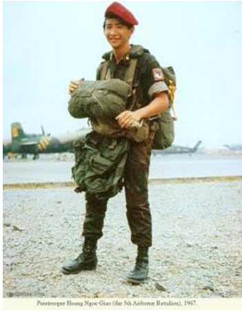
Một Thiên Thần Mũ Đỏ chuẩn bị một "saut" nhảy

hoang tàn với hàng rào Concertina ngổn ngang như hoang phế lâu ngày, nhìn sâu vào trong trại, tôi thấy thấp thoáng những bạn bè, chiến hữu chúng tôi đang vội vã di chuyển trong đó. Tôi không hiểu tôi đang là một thứ người gì, nhưng tôi đang đứng sững nghiêm chỉnh trước chiếc cổng như đại diện cho đơn vị, đơn vị tôi tôn thờ như thánh thần trong tâm khảm. Những ngày tung hoành ngang dọc nào có mơ ước gì hơn là tiêu diệt kẻ thù để đồng bào được yên ổn làm ăn.