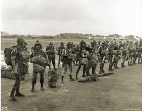
Xếp hàng chuẩn bị nhảy dù

man mà loài người không tưởng tượng nổi. Chúng tôi không một oán hờn với những người làm đường lạc lối, nhưng nay đã thức tỉnh. Chúng tôi không một ngạo mạn với những bạn bè cùng chung chí hướng, những ân tình của dân chúng đã vun đắp chúng tôi thành một ý chí sắt đá nguyện đem tấm thân còn lại trở về quê hương.