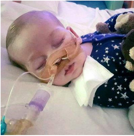
Bé Charlie đáng thương.