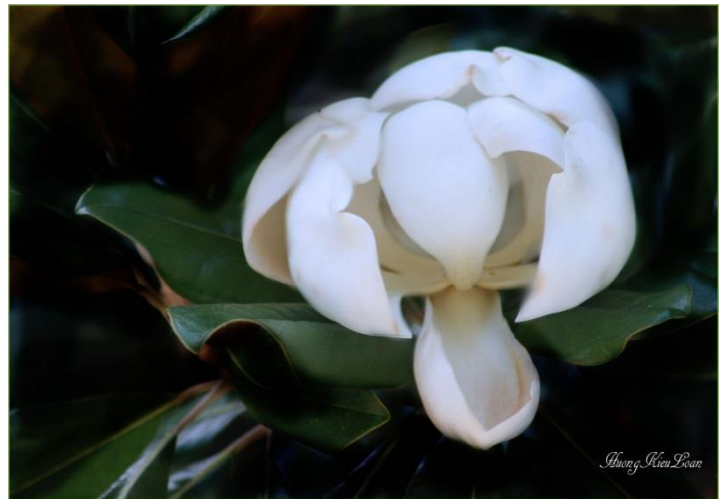
Thè lưỡi: "Eo ơi, thời gian trôi mau!"