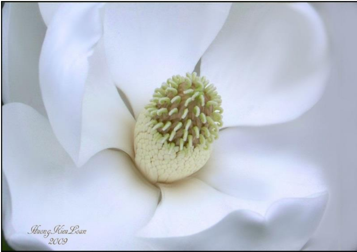
Nhưng vẫn mượt mà