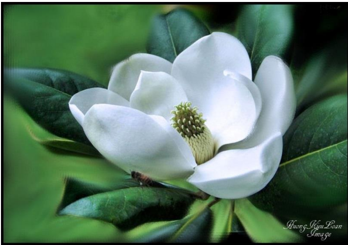
Tuổi đôi mươi