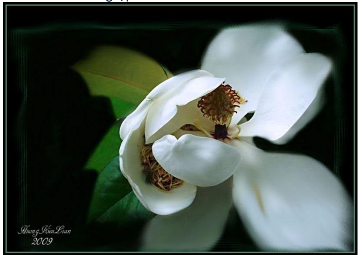
Dấu rồi, thôi đừng nhìn nữa.!

===== Tôi thích lắm những hình ảnh hơi khác người một chút.