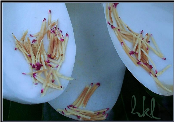
Những chiếc que diêm