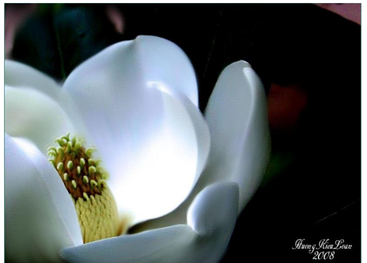
Nay đã mãn khai