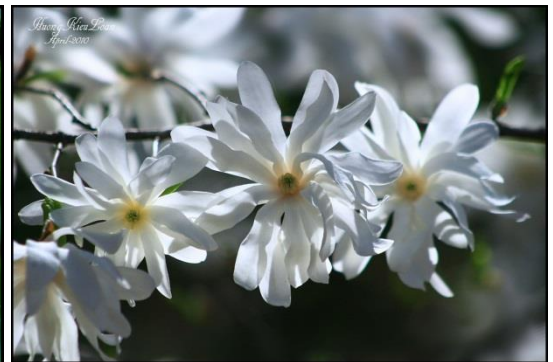
Loại Magnolia trắng cánh mỏng, và magnolia màu hồng