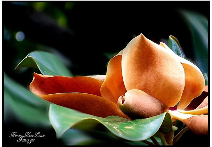
Rồi tuổi vàng ập đến ! và...