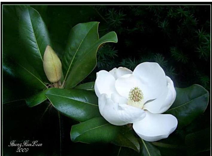
Mới thưở nào còn xuân sắc