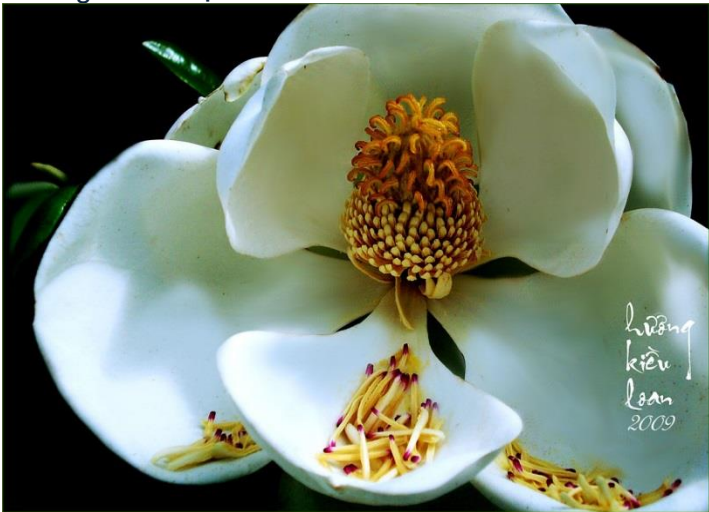
Răng lần lượt rủ nhau ...rơi ! ((=