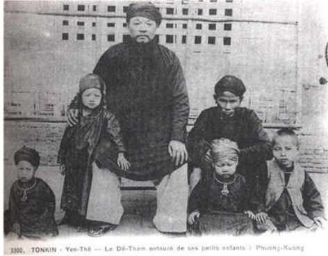
Nhà cách mạng Hoàng Hoa Thám, tức cụ Đề Thám, chụp ảnh bên các cháu của ông.

Thế rồi từ cô gái bán hàng với số lương 200 quan mỗi tháng, cô Thế đã nghiễm nhiên thành một tài tử chiếu bóng với số lương 2000 quan mỗi tháng, từ đây với số lương gấp mười, cô sống một cuộc đời tạm gọi sung túc.