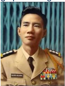
Nguyễn Văn Đông

Tôi cho rằng Hà Thanh có giọng hát thiên phú, cô hát rất thoải mái dễ dàng, không cầu kỳ, không cường điệu, không gò bó nhưng nó cuốn hút ta đi trong cái bình bông không gò ép đó. Tôi cảm ơn tiếng hát của Hà Thanh đã mang lại cho các bài hát của tôi thêm màu sắc, thêm thi vị, bay bổng. Trước khi đến với Hà Thanh, tôi cũng rất ngưỡng mộ tiếng hát của cô Thái Thanh, Lệ Thanh, Khánh Ngọc và nhiều người khác đã gieo khắp phương trời tiếng lòng của tôi, cũng như về sau này có thêm các cô học trò như Thanh Tuyền, Giao Linh đã giúp cho ông Thầy truyền tải đến trái tim người yêu nhạc. Nhưng đặc biệt, tiếng hát Hà Thanh đã để lại trong tôi nhiều kỷ niệm tốt đẹp, bền bỉ tuy thời gian ngắn ngủi kể từ khi cô bỏ đi lấy chồng để tôi độc hành trên đường nghệ thuật. Sau biến cố 1975, tôi không còn dịp hợp tác với cô Hà Thanh như trước đây. Nhưng thỉnh thoảng tôi được nghe cô hát một sáng tác mới của tôi ở hải ngoại, tôi vẫn cảm thấy tiếng của cô vẫn đậm đà phong cách ngày xưa, vẫn một Hà Thanh diễn cảm, sang trọng, sáng tạo trong khi hát, mặc dù thời gian chia cách đã 40 năm qua.