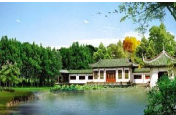
Kim Ngưu tân quán Thành Đô Tứ Xuyên (成都宾馆金牛)

Buổi chiều, cuộc đàm phán bắt đầu, Nguyễn Văn Linh lần đầu tiên thực hiện một bài phát biểu dài. Mục đích mong muốn bày tỏ giải quyết các vấn đề Campuchia càng sớm càng tốt, đồng thời đàm phán việc thành lập Hội đồng tối cao của Campuchia là một phần ưu tiên, không nên loại trừ bất kỳ bên nào, không thể bày tỏ sự miễn cưỡng để can thiệp vào công việc nội bộ của Campuchia. Xem ra về vấn đề Campuchia, Nguyễn Văn Linh có vẻ chỉ muốn bày tỏ thái độ tuyên bố về nguyên tắc,