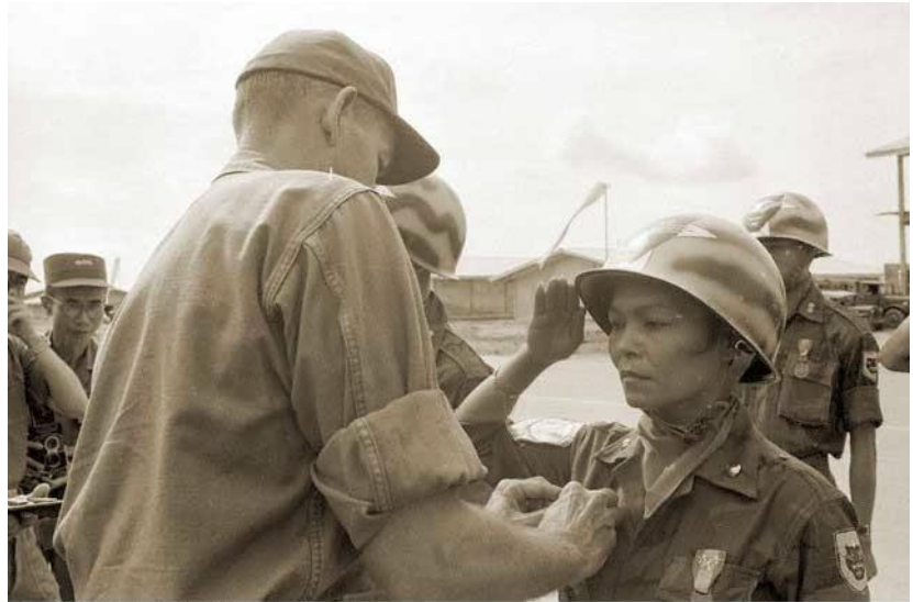
The Tiger Lady Being Presented Award