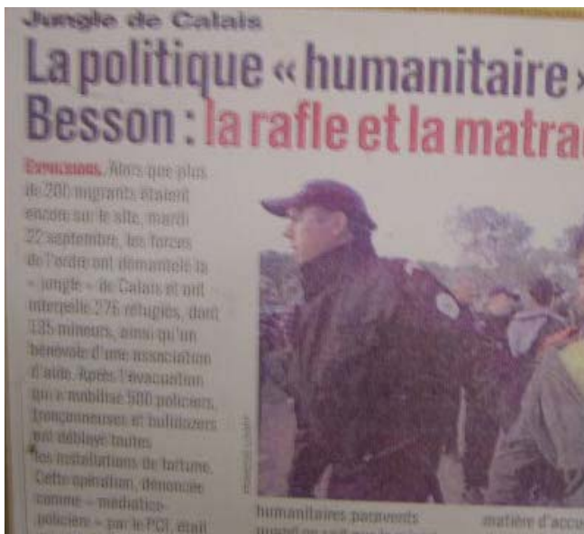
Báo Pháp loan tải, đóng cửa bãi Parc St Pierre

Đến đây chúng tôi không còn quan tâm lời nói của bí danh Thanh nữa đành phải xin lỗi cắt điện thoại.