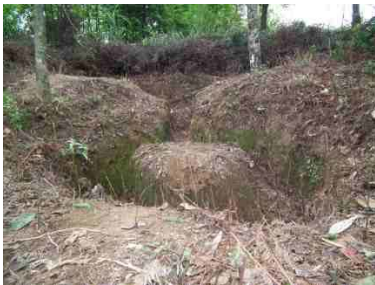
Quân đội Trung Cộng lập chiến hào theo mẫu Ách-chuồn tại núi cao thuộc điểm (D) trong lãnh thổ của Việt Nam, nay thuộc biên giới Trung Cộng.

Lúc này tôi mới thực sự rùng mình trước tầm quan trọng của vòng chiến lũy 1, nó chạy dài từ Đông qua Tây, và nó còn nguyên vẹn những bằng cứ doanh trại bộ chỉ huy chiến trường mà Trung Cộng đã lập ở đây, ngoài ra dày đặc chiến hào bao phủ phần ngoài chiến lũy, tạo thành một phòng ngự kiên cố. Lần đầu tiên tôi thấy, rất ngạc nhiên, chiến hào thiết lập theo mô hình con Ách-chuồn, do tổ tam tam cố thủ, một khi chiến binh đã ách thủ thì không rời chiến hào, người chiến binh phải tuân theo mệnh lệnh và qui luật quân đội Trung Cộng.