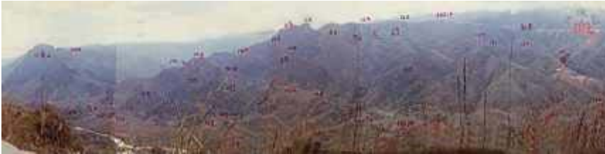
Việt Nam hay Trung Cộng chiếm được những địa hình chiến lược núi cao 4.200m, sẽ làm chủ nhân ông của 6 tỉnh biên giới, như Lai Châu, Lào Cai, Hà Giang, Cao Bằng, Lạng Sơn, Quảng Ninh. Nguồn ảnh: NBLChín (9)