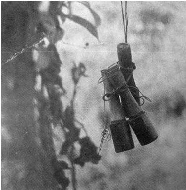
Chúng tôi đi vào một đoạn chiến lũy đầy chướng khí của tử thi, trên đầu lúc nào cũng có những chùm lựu đạn, cài trên cành cây, sẵn sàng nổ khi người vấp phải bẫy mìn.