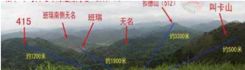
Sáu (6) địa hình chiến lược núi cao, gồm có núi Ban Đoàn Nam Tắc (415) 1.200m, núi Ban Đoàn Nam Tắc hai 1.500m, núi Vô Danh 1.900m, núi Khẩu Đức Sơn (512) 3.300m, núi Thiệu Khả Sơn 500m, kiểm soát được phía Đông như Cao Bằng, Lạng Sơn và Quảng Ninh.

— Sau khi Trung Cộng bỏ đồng bằng và 6 tỉnh ly, rút quân tập kết tại những vị trí chiến lược giao thông hào 3, đứng về chiến thuật xem như chiếm được 3 tỉnh phía Tây trên đường biên giới Việt Nam - Trung Cộng. Và 6 địa hình phía Đông với tầm cỡ chiến lược vô tận cũng đồng loạt vào tay Trung Cộng, trên thực tế Việt Nam chưa hoàn toàn mất nước, nhưng nhà quân sự thì có cách nhìn tương lai hơn, cho nên lực lượng quân sự Trung Cộng trấn giữ giao thông hào thứ 3 làm biên giới tiền tuyến, và có đến 26 tướng lĩnh tham chiến vào ngày 17/02/1979 dưới sự động binh của Đặng Tiểu Bình.