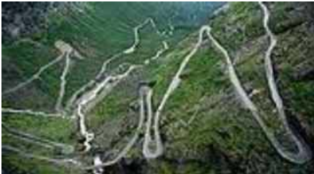
Hành lang chiến lũy thứ 2, trong lãnh thổ Việt Nam do quân đội chủ lực Trung cộng đang trấn ngự.

Còn chiến lũy thứ ba khuất bên kia rặng núi do Bộ Tư lệnh Quân khu Quảng Tây điều động, chỉ huy chiến trường, dưới sự giám sát của Bộ trưởng Bộ Quốc phòng Trung Cộng, đồng thời một Ủy viên Hội đồng Quốc phòng và An ninh quốc gia, Phó Bí thư Đảng ủy Quân sự Trung ương Trung Cộng, tập hợp thành Bộ Tham Mưu chiến tranh để bành trướng xuống hướng Nam Việt Nam.