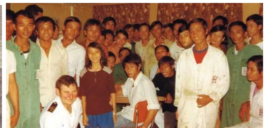
Tàu buôn của Canada: Avon Forest --- 40 người chụp hình cùng với thuyền trưởng tàu Avon Forest

Trước khi đi, tôi nghĩ rằng gia đình tôi, nếu may mắn sống còn, sẽ đến một nước tự do nào đó, được chính phủ quốc gia đó cấp cho vài mẫu đất xa xôi để trồng trọt, nuôi heo gà sinh sống. Nơi đó, có lẽ không có bóng một người đồng hương nào và chỉ sống chung với những người bản xứ mà thôi. Buồn lắm, nhưng thôi thì như vậy cũng được, làm thân tỵ nạn còn đòi hỏi gì hơn nữa, thoát khỏi nanh vuốt CS là may lắm rồi. Với hai bàn tay của những người quyết tâm xây dựng cuộc sống trong tự do, gia đình năm người chúng tôi có thể sống mà không bị hạch hỏi, phờng kê, khóm gọi, trình diện lên trình diện xuống, nay họp mai hành, làm khó làm dễ, như khi còn ở trong nước. Thằng con trai 16 tuổi của tôi - dù luật CS là 18 tuổi mới là tuổi đi lính - thế mà vẫn được giấy báo trình diện đi làm "nghĩa vụ quân sự". Thằng nhỏ phải trốn trong hồ chứa nước trên mái nhà mỗi khi có phờng khóm đến tìm. Rồi muốn cho an toàn hơn, tôi phải đến phờng xin giấy phép đi đường, về Gò Công, lo lót chủ tịch khóm phờng, đổi tên thằng nhỏ từ Lê Duy thành 1 cái tên khác, từ 16 tuổi xuống thành 14 tuổi để tránh tuổi phải làm nghĩa vụ quân sự, đánh giặc ở Cao Miên.