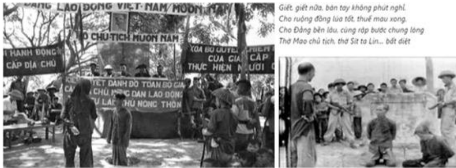
Hình: Tội ác của Hồ Chí Minh và ban cộng phỉ. Mọi người còn nhớ hay quên? Hình: VC giết người cướp của trong cái gọi là "cải cách ruộng đất năm 1954:

Nhưng thực tế chuyên chính vô sản đã diễn ra vô cùng bạo liệt, tàn khốc, chà đạp man rợ lên đạo lý, văn hóa và quyền con người ở tất cả các nước cộng sản nắm chính quyền. Sự dã man quy quyết máu lạnh và sự bất nhân khéo che đậy của Cộng sản chưa hề thấy trong lịch sử loài người.