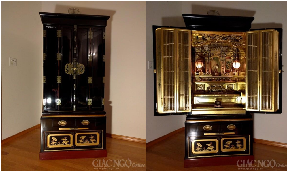
Sau đôi cánh cửa đen ấy là một thế giới tâm linh trang nghiêm, tràn đầy Phật lực

Chiếc tủ có chiều cao khoảng 1m5, phần dưới có các hộc tủ, phần trên có bộ khung cửa 4 cánh được đính bản lề kim loại rất tinh tế nhưng vững chắc khiến Quân có ngay cảm tưởng nặng lực thiêng liêng, cao quý bên trong. Quân bước từ từ đến trước chiếc tủ, ông Ted dõi mắt nhìn theo. Quân đứng lặng yên vài giây, nghiêm trang chấp tay kính cẩn xá một xá. Không gian tĩnh lặng quá, Quân nghe được cả tiếng tim mình đập. Anh hồi hộp mở 2 cánh cửa: một vùng hào quang lung linh phản chiếu diệu kỳ, Quân giương to mắt ngạc nhiên trầm trồ!