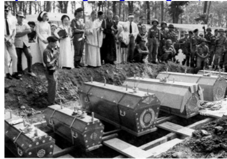
Ảnh "Vietnam, A Chronicle of the War", Black Dog & Leventhal Publishers, Inc. 2003, pg.478