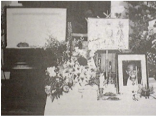
Linh cữu Cố Thiếu Tướng Nguyễn Ngọc Loạn