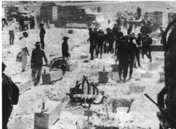
Nạn nhân Tết Mậu Thân tại Huế