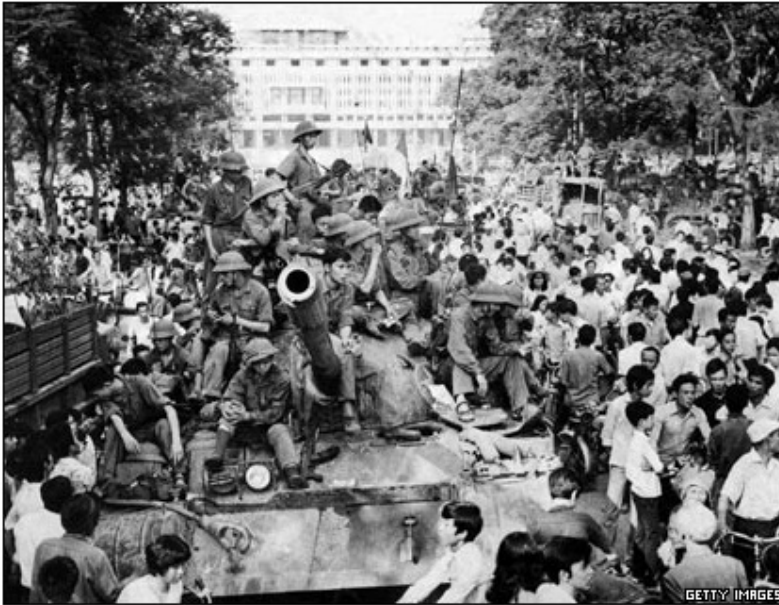
Cộng Sản chiếm dinh Độc Lập, Saigon, ngày 30-4-1975