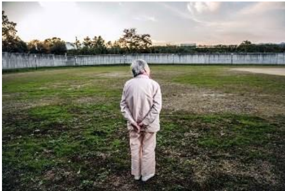
"Tôi vào tù khi đã 84 tuổi", một phạm nhân cho biết.

Cuộc sống cơm áo gạo tiền tuy còn nhiều chật vật, nhưng vợ chồng bà luôn chăm chỉ làm lụng, tích cóp để con cái có cuộc sống đủ đầy, ăn học nên người.