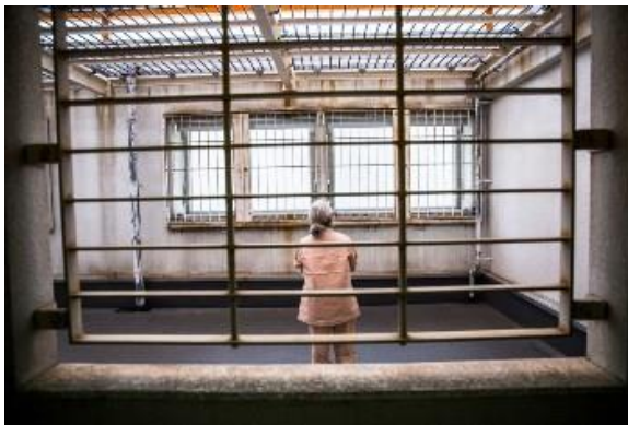
Người cao tuổi Nhật Bản thường có tình trộm cắp vặt, để được sống trong nhà tù.

run. Cuộc sống trong tù khiến người phụ nữ này vui vẻ và cười nhiều hơn. "Con trai tôi cứ khẳng khái là tôi bị thần kinh, phải chữa trị. Thực ra, tôi áp lực và cô đơn quá, mới buộc phải ăn trộm", người phụ nữ giải thích.