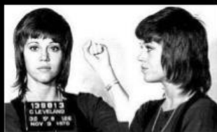
Jane Fonda angered many Americans when she went to North Vietnam to protest the United States involvement in Vietnam. Her actions still haunt her today.