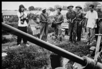
While we were fighting the Vietnam War, Jane Fonda went to North Vietnam to pose for propaganda pictures with people who were killing Americans. Most notoriously, she was photographed at a Vietnamese anti-aircraft gun. She also did Tokyo Rose style broadcasts, attacking her own nation.

According to rumors, when a group of POWs were brought out to visit with Fonda ...she walked the line, shaking each man's hand and asking little encouraging snippets like: "Aren't you sorry you bombed babies?" & "Are you grateful for the humane treatment from your benevolent captors?" Many of the POW's were listed as missing in action so to identify themselves to American authorities, they each wrote their Social Security numbers on small pieces of paper and slipped them to Fonda as she greeted them. To their horror, however, after Fonda finished meeting them, she turned to the North Vietnamese commanding officer and handed him the POW's pieces of paper. In the beatings that followed, three American POW's died.