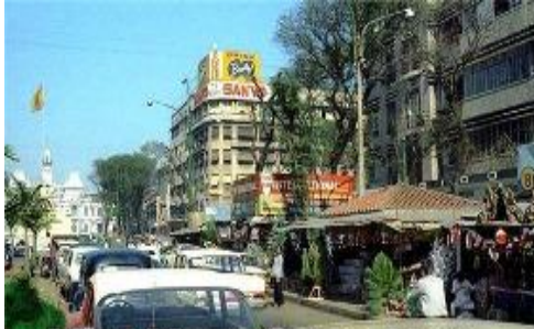
Việt Nam Cộng Hoà những Mùa Noel cũ

Không khí lễ Christmas đang rộn ràng khắp trời Bắc Mỹ có lẽ cũng gợi đôi chút nhớ nhung cho không ít độc