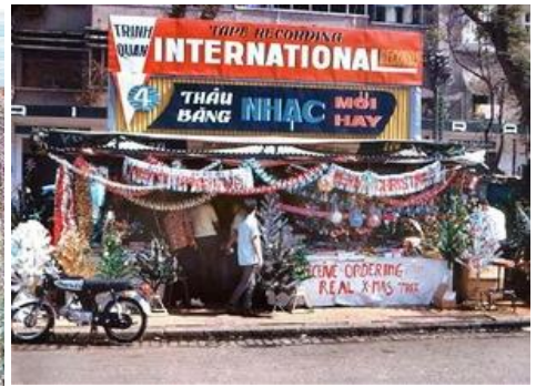
Binh sĩ Đồng Minh phát quà cho trẻ em Việt trong vùng chiến sự mùa Noel 1965. Góc chính nhân một chiều Noel 1966. Đường Phố cửa hàng đóng mừng lễ Giáng Sinh

Nhạc Giáng Sinh Việt không rộn ràng như nhạc Noel Âu Mỹ, trái lại còn có thể ảm đạm, thậm chí buồn bã nữa. Giai điệu lẫn ca từ ám ảnh nỗi buồn chiến tranh (những cuộc tình phân ly, những người tình cùng đi Lễ nửa đêm, cùng quỳ thề nguyện trong Giáo đường, những yêu nhau rồi lại xa nhau, v ...v...).