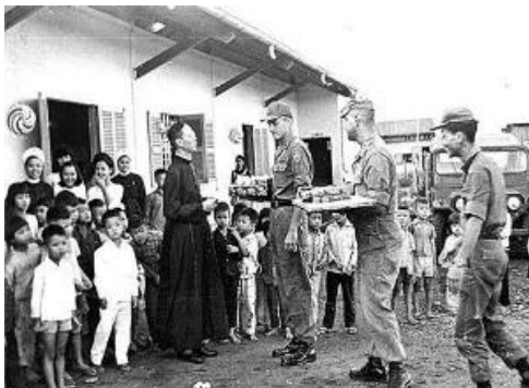
Giáng Sinh 1965, binh sĩ Việt Nam Cộng Hòa, và đồng minh tặng quà cho trẻ cô nhi một trại mồ côi của Công Giáo tại Xuân Lộc.

Đúng buổi chiều Giáng Sinh 1964, Khủng Bố Việt cộng gài nổ xe bom tại Cư Xá Brinks (nằm trên đường Hai Bà Trưng Quận 1 Sài Gòn) giết hại 2 binh sĩ Đồng Minh, và nhiều thường dân Việt. Ngày nay, nơi này thành Park Hyatt Hotel.