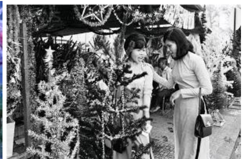
Nữ lưu Việt Nam Cộng Hòa những ngày Noel cuối năm 1970.