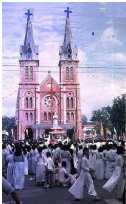
Nhà Thờ Đức Bà Sài Gòn chiều Noel 1964.

Lời hát thường vang lên vào dạo đầu tháng 12, nửa như báo trước một mùa Lễ lớn sắp về, nửa như nhắc nhớ hoàn cảnh loạn ly của xứ sở.