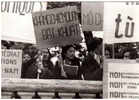
Sinh viên tại Pháp biểu tình sau 1975

Những ngày cuối tháng 4 của 40 năm về trước, hàng ngàn sinh viên du học ở Pháp, Đức, Bỉ.v.v. đã đón nhận những bản tin dồn dập đến từ quê hương với tâm trạng hụt hẫng, hoang mang. Từ những thanh niên đang ở độ tuổi hồn nhiên, bỗng chốc họ trở thành những kẻ vô Tổ quốc với những lo toan cho một tương lai vô định. Anh Nguyễn Đình Hải, sinh viên du học tại Bỉ từ năm 1969 bày tỏ: “ Trước đó tụi này theo dõi tình hình trên báo chí và đài truyền thanh, truyền hình rất cẩn kẽ. Ngày 30/4 khi nghe tin Sài Gòn thất thủ thì phải nói là tụi này rất là hoang mang, mình không biết mình phải làm gì trong thời điểm đó. Sau đó là một cơn buồn ray rứt bởi vì khi mình đi ra khỏi đất nước, mình đi với hoài bão một ngày nào đó mình sẽ trở về để mình đóng góp, xây dựng, lúc bấy giờ mình cảm thấy mình rất là bơ vơ và hoang mang. Nhưng mà liền sau đó thì tụi này nghĩ mình vẫn phải tiếp tục làm cái gì đó để hữu ích cho đất nước, thì lúc đó tụi này đứng ra thành lập ‘Nhân bản dân tộc văn nghệ đoàn’. ”