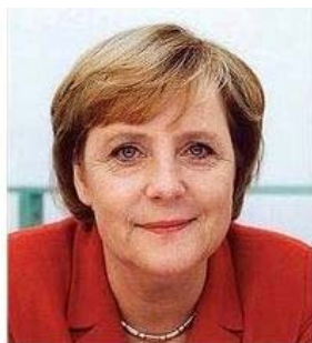
Thủ Tướng Đức Angela Merkel: *Cộng Sản đã làm cho người dân trở thành gian dối