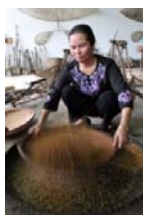
Bà đang sàng gạo