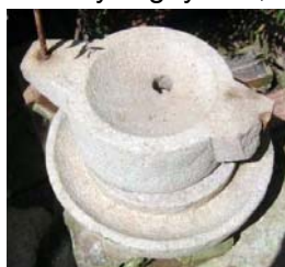
Cối xay bột

3.- Cối xay bột : Sau khi dùng Cối giã gạo để có gạo trắng nấu cơm ăn mỗi ngày, giống như người Pháp ăn bánh mì vậy. Nhưng muốn có bột để làm bánh, thì phải dùng gạo ngâm nước trước một đêm trước khi xay ra bột. Cối xay bột, làm bằng khối đá, rồi đẽo thành hai thớt trên và dưới như hình kể bên đây. Ngày xưa, nhứt là trong dịp cận Tết, thông thường, quý bà con đồng hương dùng Cối xay bột để xay ra bột, rồi làm các loại bánh, đặc biệt còn mang bột đến lò để tráng các bánh tráng như : bánh tráng mỏng để làm bánh cuốn, chả giò, bánh tráng mỏng ngọt để ăn sống, bánh tráng dày để nướng. Ngoài ra, quý bà trong khi tráng bánh, còn mang theo nhưn đậu xanh, dừa nạo mới rán vỏ... rồi lấy bánh tráng ngọt mỏng làm da bánh ướt ăn rất ngon. Đó là, thời kỳ xa xưa, Cối xay bột ngày nay không còn dùng nữa, vì bột đã được bày bán khắp nơi rất tiện dụng.