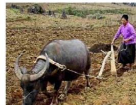
Lưới cày và trâu cày ruộng

Vì thế, công việc làm ruộng bắt đầu tháng 3 âm lịch (Tháng ba cày vỡ ruộng ra), ngày trước dùng lưới cày với đôi trâu cày đất làm ruộng. Sau đó, mới lựa lúa tốt làm giống để chuẩn bị rải lúa xuống miếng đất gieo mạ (Tháng tư làm mạ, mưa sa đầy đồng) và bừa trực miếng đất.