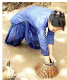
Nôm bắt cá