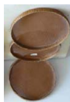
Các cái Sàng

3.- Cối xay bột : Sau khi dùng Cối giã gạo để có gạo trắng nấu cơm ăn mỗi ngày, giống như người Pháp ăn bánh mì vậy. Nhưng muốn có bột để làm bánh, thì phải dùng gạo ngâm nước trước một đêm trước khi xay ra bột. Cối xay bột, làm bằng khối đá, rồi đẽo thành hai thớt trên và dưới như hình kể bên đây. Ngày xưa, nhứt là trong dịp cận Tết, thông thường, quý bà con đồng hương dùng Cối xay bột để xay ra bột, rồi làm các loại bánh, đặc biệt còn mang bột đến lò để tráng các bánh tráng như : bánh tráng mỏng để làm bánh cuốn, chả giò, bánh tráng mỏng ngọt để ăn sống, bánh tráng dày để nướng. Ngoài ra, quý bà trong khi tráng bánh, còn mang theo nhưn đậu xanh, dừa nạo mới rán vỏ... rồi lấy bánh tráng ngọt mỏng làm da bánh ướt ăn rất ngon. Đó là, thời kỳ xa xưa, Cối xay bột ngày nay không còn dùng nữa, vì bột đã được bày bán khắp nơi rất tiện dụng.