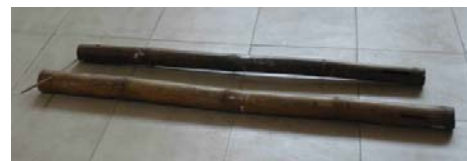
Cái trúm đặt bắt lươn

(Nếu cần tìm hiểu thêm phương cách Soi cá, Câu cá, Nhấp cá, Cắm câu, Giăng câu, Bủa lưới cá, Đặt lò bắt cá Sắt, Đặt trúm bắt lươn, bắt chuột.... xin mời tìm đọc các bài viết của nhà văn Lê Cần Thơ, chủ bút tạp chí Văn Hóa Việt Nam, phát hành Houston, Texas, Hoa Kỳ, đặc biệt bài viết của Anh Kể Chuyện Bắt Cá Miệt Vườn Trên Sông Nước Quê Tôi , đã đăng trên đặc san Phù Sa Cửa Long Xuân Kỷ Sửu 2009 từ trang 93 đến trang 102, rất giá trị, trân trọng giới thiệu đến thế hệ trẻ nghiên cứu sưu tầm làm tài liệu khi cần).