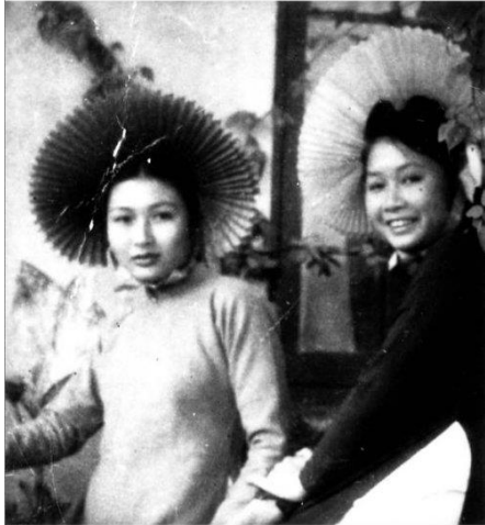
(Tâm Vấn 15 và chị cả 17 tuổi, Hà Nội 1949)

Từ đôi mắt dài đắm đuối Hà-Nội ngọt ngào Saigon ai lẽ đẽo tim Hà Nội thanh lịch Saigon nhí nhảnh sẽ vớt được chút hương đầu mày cuối mắt lớn lên vào một thuở thanh-bình hiem hoi của đất-nước ngày còn "nắng tơ vàng hiền hòa hồn có mưa sa..."